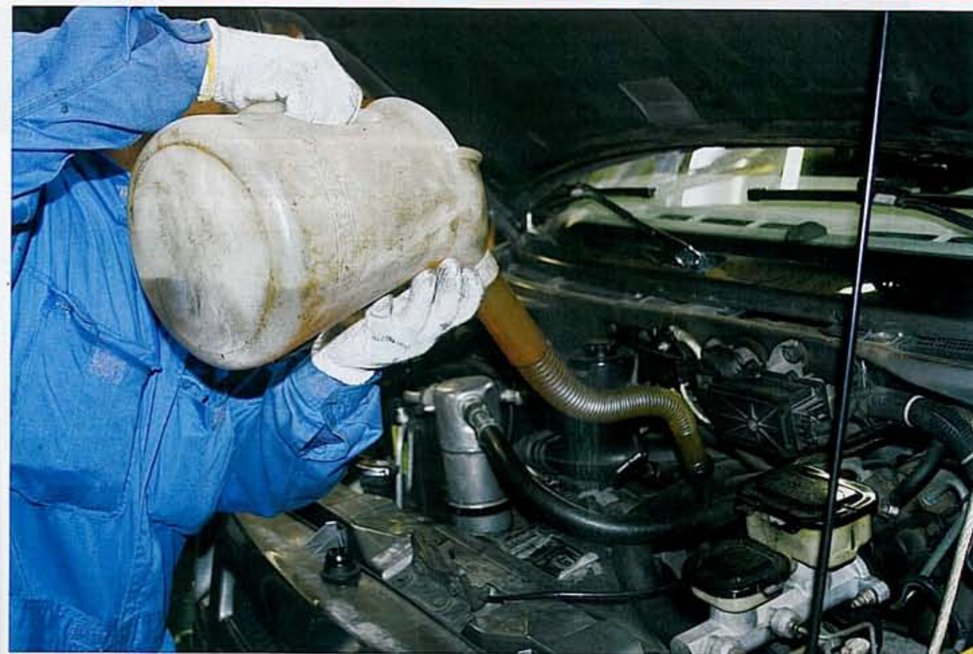
愛しのアストロはまだ元気です♪

継ぎ足しで走り続けたエンジンオイルは、もはや色んなメーカーものが入り交じっていた。こんな状態は良いわけがない。新鮮でおいしい血が欲しい〜!