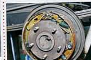
原因発見。スピンドルを囲むABSセンサーのプラスチック台座がヒビ割れ、定位から外れていたのだ。それがローターに当たり異音が発生していた。