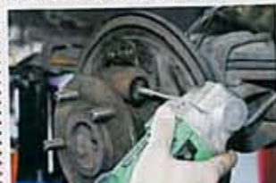
シリンダー内を傷付けないように注意を払いクリーニングしていく。