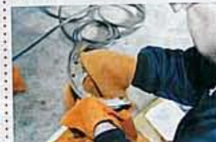
スプリングの交換中は、関係者総出でパーツのクリーニング。もう夜は深い。