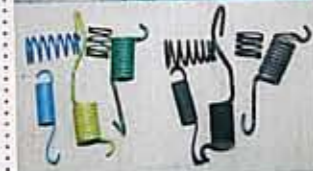
こんな小さなスプリングでも、いまだ新品で手に入れることができるのはうれしい。