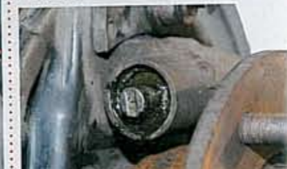
表面ブッシュを取り外すと、ドロドロと水が漏れてきた。これのせいでピストンの動きが鈍るのである。