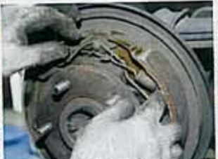
続いてドラム内にある細かいスプリングを新品に交換していく。