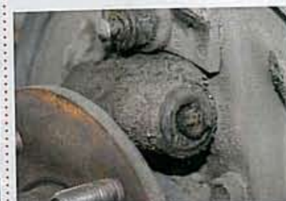
表面ブッシュを取り外すと、ドロドロと水が漏れてきた。これのせいでピストンの動きが鈍るのである。

ブレーキオイルの油圧でリアシューをドラムに押し当てブレーキングするドラムブレーキ。前回そのブレーキオイルが密封されているホイールシリンダーに、水没入の疑いがあることが判明。ただちに分解してブッシュ交換でオーバーホールが必要となった。続いて、これも前回判明した、ドラム内のスプリングが弾力を失っていたことで十分なチカラを発揮していないこともあり、各スプリングなども新品に交換することにした(左右両方)。