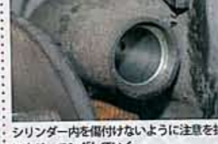
これがリアドラム内にあるホイールシリンダー。外側よりも内部が汚れているとかなりマズイ。